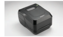
流线设计、轻巧、效能稳定