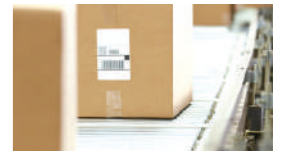
快速打印 (6 ips)— 节省工作时间