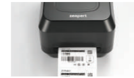
双模打印选择— 支持热感&热转