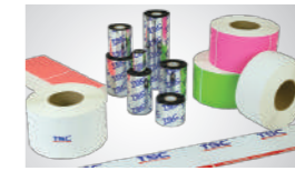
多元打印应用— 搭配标签编辑软件