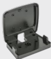
• 90ACC0299 桌面/挂墙式