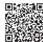
爱普生 微信服务号