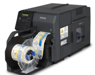
EPSON TM-C7520G 超高速全彩色标签打印机