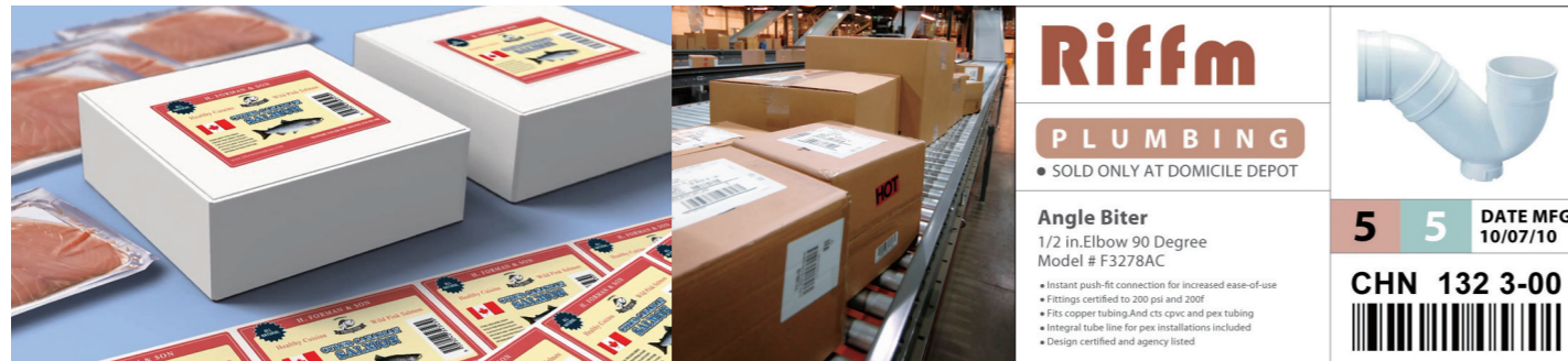
制造行业外箱标签

在彩色标签打印领域，TM-C7520G是使用爱普生最新 PrecisionCore™ 行式打印技术的全新一代全彩色标签打印机。基于爱普生特有的ESC/Label 指令语言，替代了预印刷彩色套打可变信息的传统模式，实现超高速高质量的彩色标签按需打印！