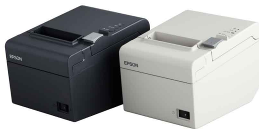
EPSON TM-T81II 热敏票据打印机