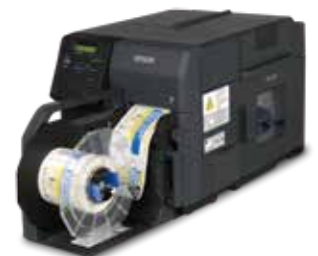
EPSON TM-C7520G / C7520 高速全彩色标签打印机