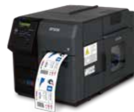
EPSON TM-C7520G / C7520