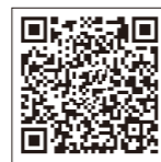
爱普生 微信服务号