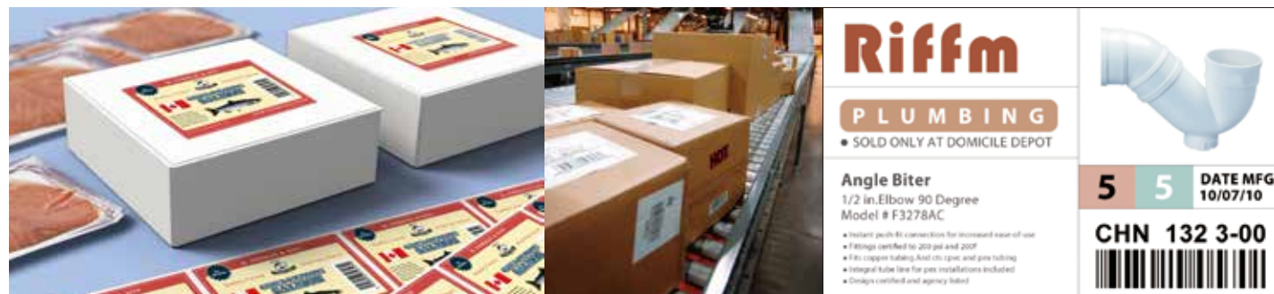
制造行业外箱标签

在彩色标签打印领域，TM-C7520G/C7520是使用爱普生最新PrecisionCore™ 行式打印技术全彩色标签打印机。基于爱普生ESC/Label 指令语言，替代了预印刷彩色套打可变信息的传统模式，实现高速高质量的彩色标签按需打印！